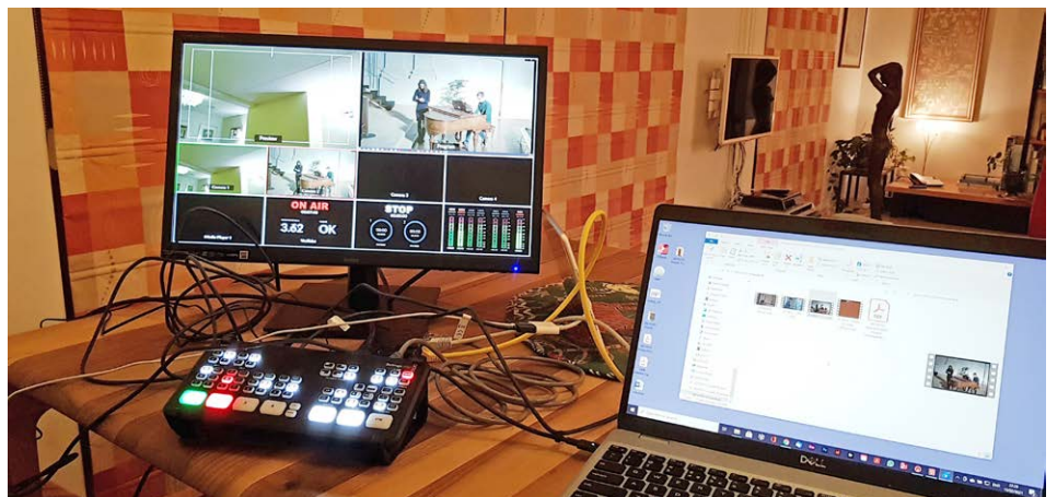
Testopstelling thuis uitzendapparatuur voor Pro Rege

Wie had vorig jaar in de eerste week van maart 2020 kunnen bedenken dat de meesten van ons vanaf half maart de kerkdiensten niet meer fysiek zouden kunnen bezoeken?