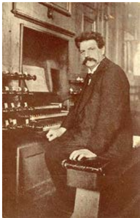
Albert Schweitzer in Deventer

twintigste eeuw bepaald: originele denker over religie en ethiek, uitmuntend Bachkenner, arts met een levensmissie in Afrika, Nobelprijswinnaar, intellectueel met wijsheid, radicale wereldverbeteraar. Schweitzer wordt steeds opnieuw herontdekt. De consequente manier, waarop hij gestalte geeft aan de eenheid tussen gelovig denken en ethisch leven blijft inspirerend. Dit najaar willen we twee of drie avonden stil staan bij verschillende aspecten en de grote geestelijke, intellectuele, muzikale en gelovige erfenis van deze veelzijdige man. Op woensdag 28 oktober is de eerste avond. We verkennen Schweitzers biografie. Daarna verdiepen we ons in Schweitzers belangrijkste theologische inzicht: zijn visie op Jezus. Schweitzer heeft zo een sterk inzicht op Jezus beschreven, dat theologen na hem, tot nu, daar niet omheen kunnen.