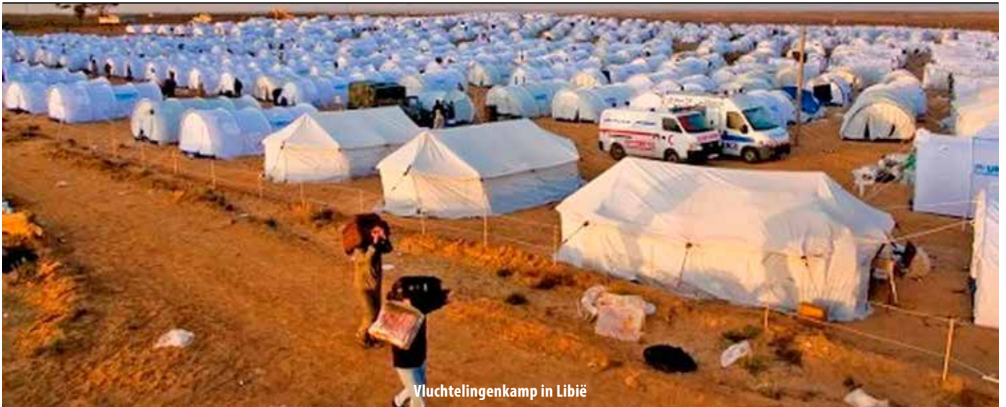
Vluchtelingenkamp in Libië