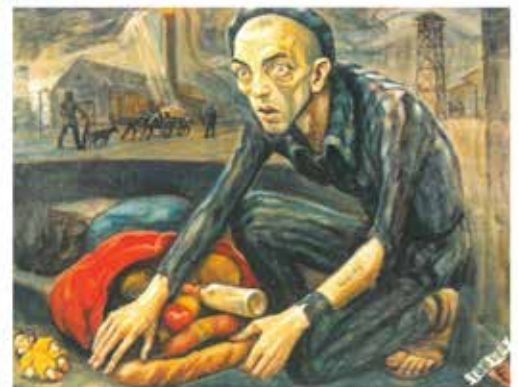
David Olère, zelfportret, 1952

onder verantwoordelijkheid van de kerken in Rotterdam en leden van de Joodse gemeenschap in Rotterdam