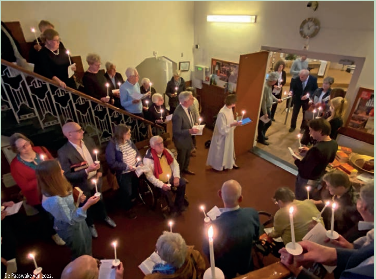
De Paaswake van 2022.