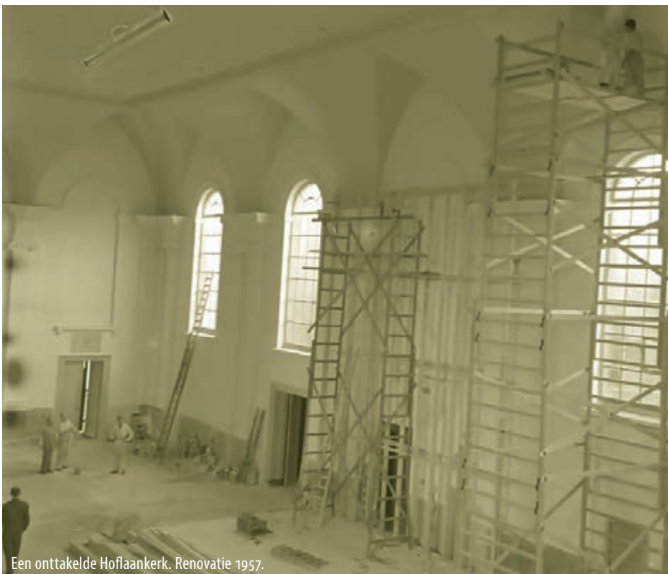
Een onttekende Hoflaankerk. Renovatie 1957.